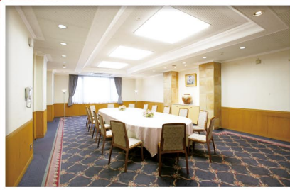
ソネット<少人数用>