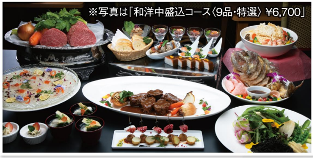
※写真は「和洋中盛込コース(9品・特選) ¥6,700」